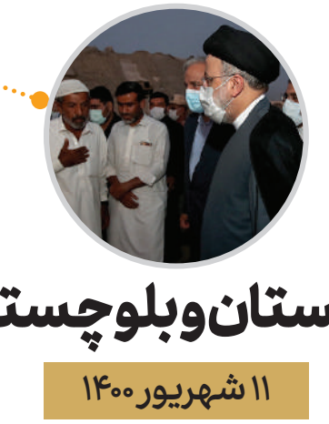
سیستان و بلوچستان