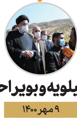
کهگیلویه و بویر احمد